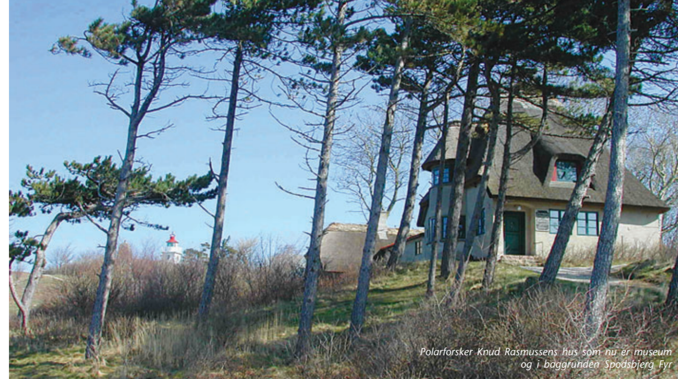
Polarforsker Knud Rasmussens hus som nu er museum og i baggrunden Spodsbjerg Fyr

Fjordens dybe render er udformet først af istidens smeltevandsstrømme, senere af fastlandstidens flodløb. Kulhus Rende står med 15 m's dybde skarpt nedskåret i de omliggende lavvandede områder. Navne som Store Tørvegrund (1) på disse flak antyder, at det er gammel landoverflade. Senere for 6.500 år siden, da vandstanden i stenalderhavet steg op til 5-7 m over den nuværende vandstandslinie, blev disse landområder overskyttet. Roskilde Fjord og Isefjord kaldes derfor for et druknet moræne landskab, hvis bugtede kystlinie med øer og holme tegnes af morænelandskabets uregelmæssige overfladeform. Her i læ har havets udligning af kystlinien ikke kunnet finde sted. Langs Roskilde Fjord fra Sølager til Hanehoved ligger udstrakte strandengsarealer (2), som forland til de tidligere kystskrænter. Når man kommer med færgen fra Rørvig ses de karakteristiske stejle skrænter, der præger indsejlingen til Isefjord og Roskilde Fjord.