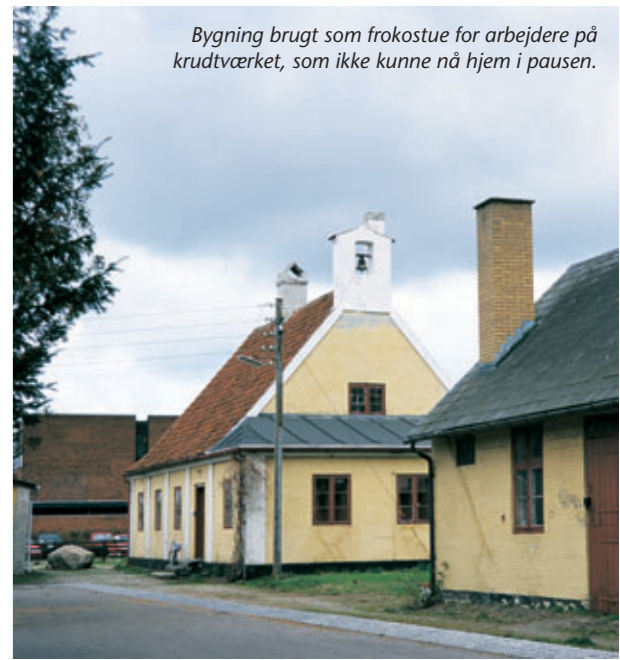
Bygning brugt som frokostue for arbejdere på krudtværket, som ikke kunne nå hjem i pausen.